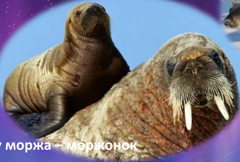
у моржа – моржонок