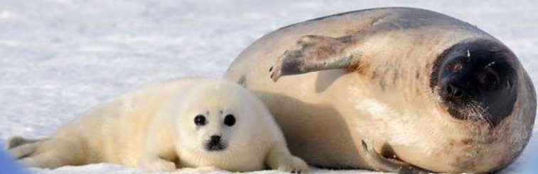
у тюленя – тюленёнок