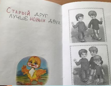
Неделя дружба и доброты Коллаж рисунков о дружбе