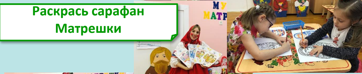
Раскрась сарафан Матрешки