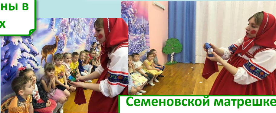
Семеновской матрешке дарим цветы