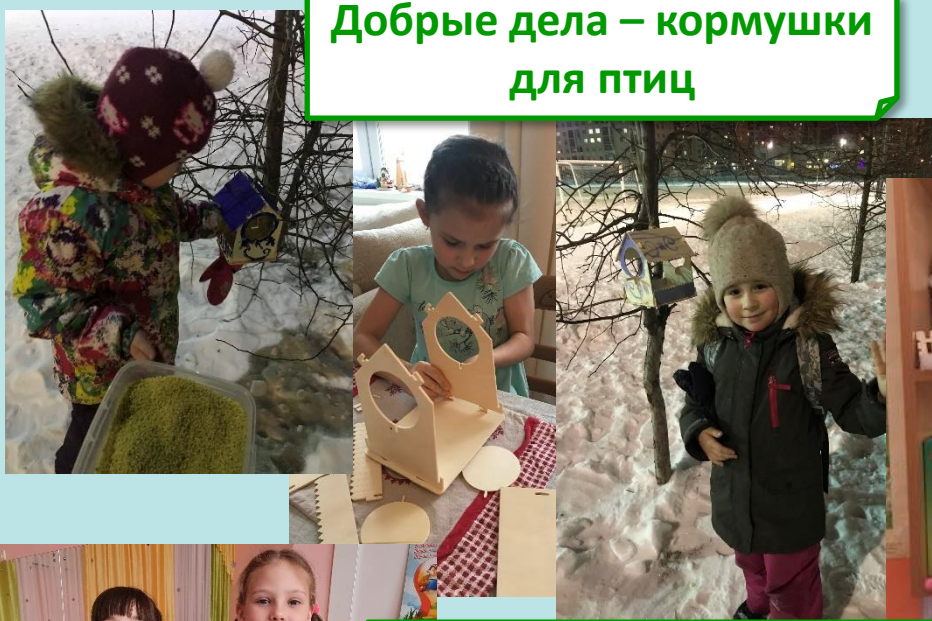
Добрые дела – кормушки для птиц

Маленькие матрешки сделали книжки-малышки с пословицами для групп детского сада