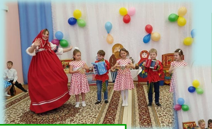
Ребята пели с Матрешкой Чапушки