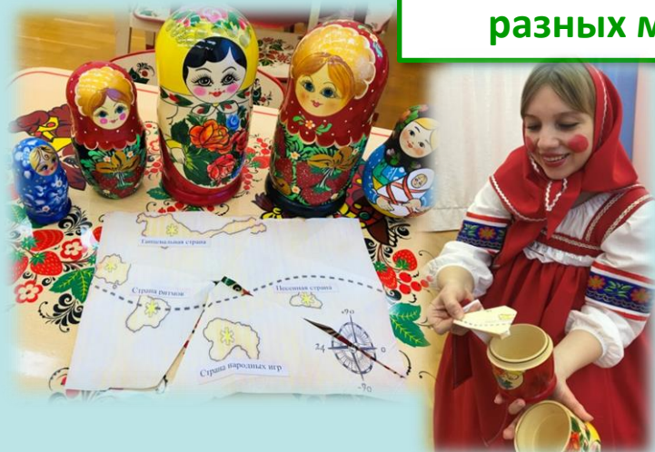
Кусочки карты спрятаны в разных матрешках

Узнаем какие бывают матрешки (Загорская, Семеновская, Гжельская, Полхов-Майданская)