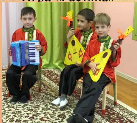
Игра на балалайках и аккордеоне