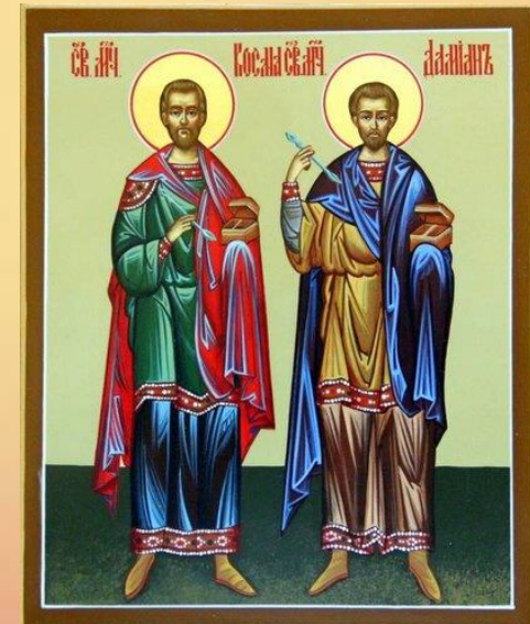
Святые угодники Косма и Дамиан