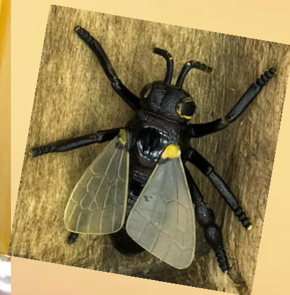
Игры с насекомыми