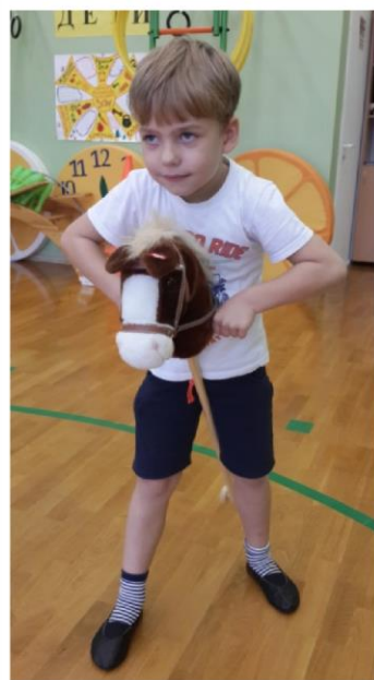
скачки на конях