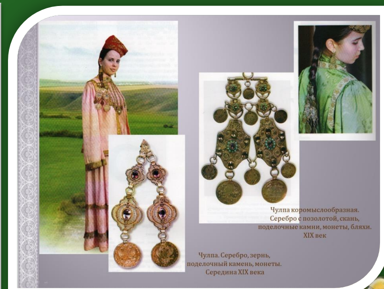
Чулпа кормыслообразная. Серебро с позолотой, скань, подельчатые камни, монеты, бляхи. XIX век