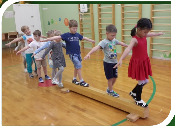
Пройти по бревну