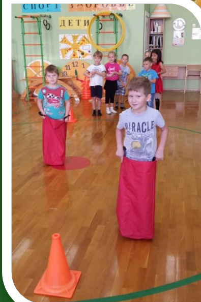
Бег в мешках