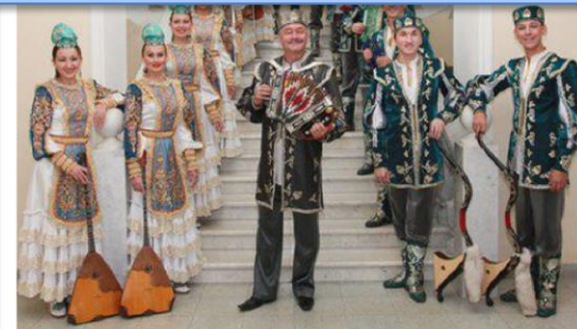
Картотека татарских музыкальных инструментов

Благодаря педагогам и родителям, создана картотека татарских музыкальных инструментов, которая отлично дополнила выставку «Татарстан». Воспитанники с удовольствием рассматривали инструменты, изучали их, сравнивали с нашими музыкальными инструментами.