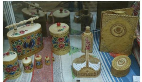
Резьба по дереву